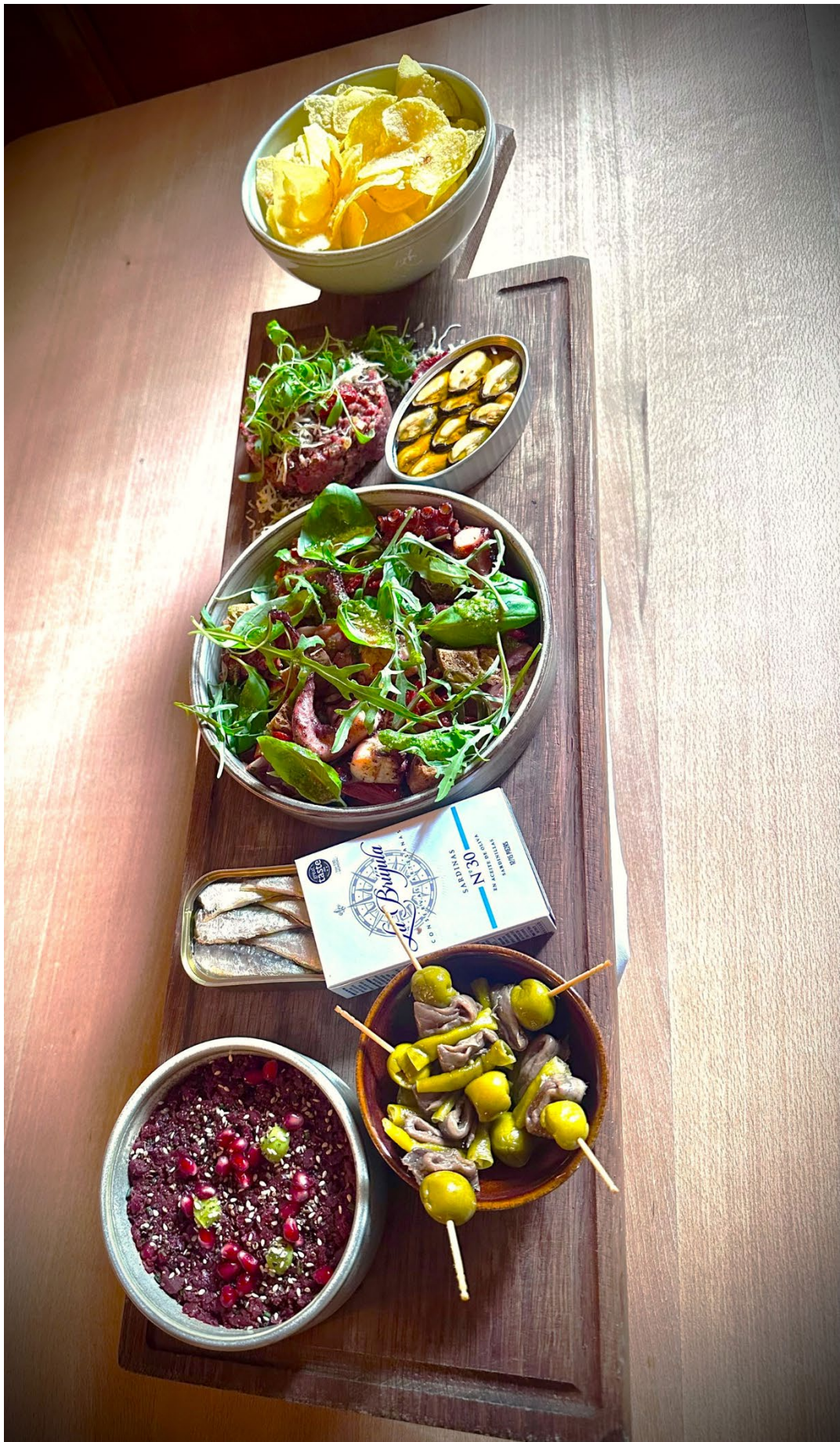
SCHLÖSSL SHARING BRETTL